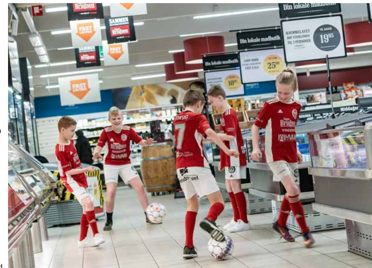
Sponsoraftaler gør en kæmpe forskel for klublivet og giver de unge gode og aktive tilbud i fritiden.