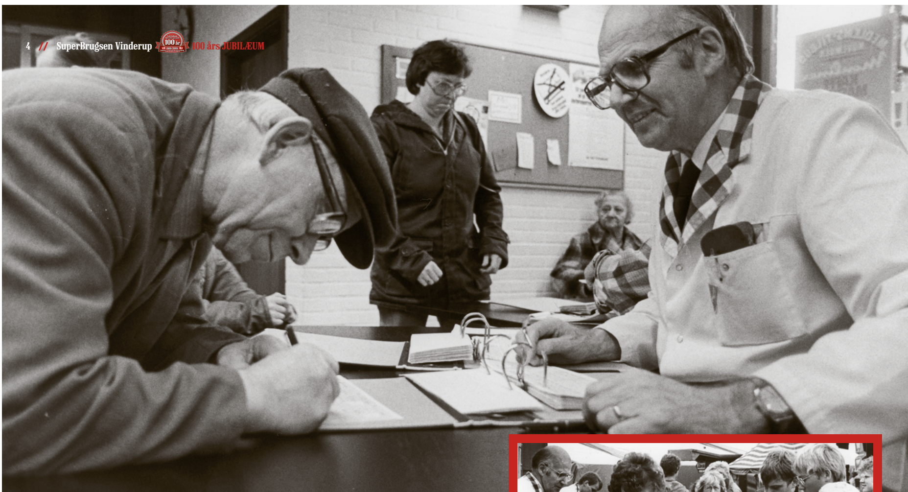
Uddeler Glibstrup udbetaler dividende.